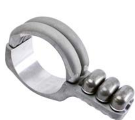
Klämma för rör och lina