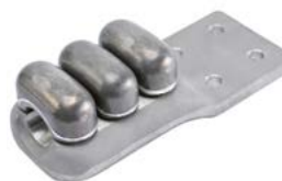
Klämma för lina med platta