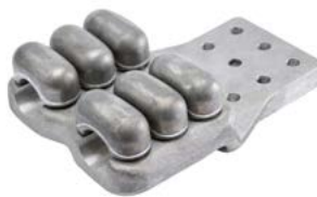
Klämma för duplexlina med platta