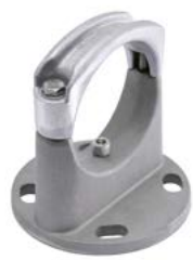
Rörhållare och stödisolator